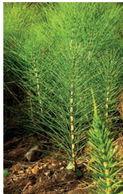
Schachtelhalm ist reich an Silizium und durch seinen verschachtelten Aufbau extrem stabil

Verrühren Sie die Bestandteile mit natürlichem Siliceagel oder Aloe-vera-Gel und weißer Heilerde, bis alles eine kuchenartigähnliche Konsistenz hat. Idealerweise mischen Sie Bergkristall-Tonic oder angesetztes Bergkristallwasser dazu, mit dem Sie auch die Haut vorbereiten.