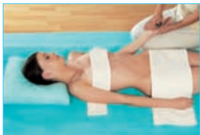
2 ... und der Handinnenflächen