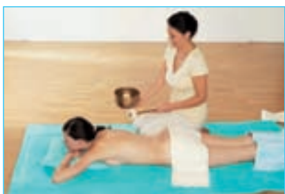
5 Abschluss mit der Klangschale

■ Dann geben Sie etwas warmes Edelsteinöl auf die Hände und verteilen es auch auf den Armen. Nehmen Sie nun wieder die warme Edelsteinkugel und massieren Sie damit die Handinnenflächen (siehe Bild 2).