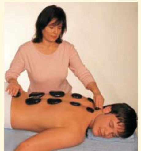
Bilder: Demonstration während des Seminars

Zentrum für Edelstein-Balance® Massagen • Seminare Kosmetik